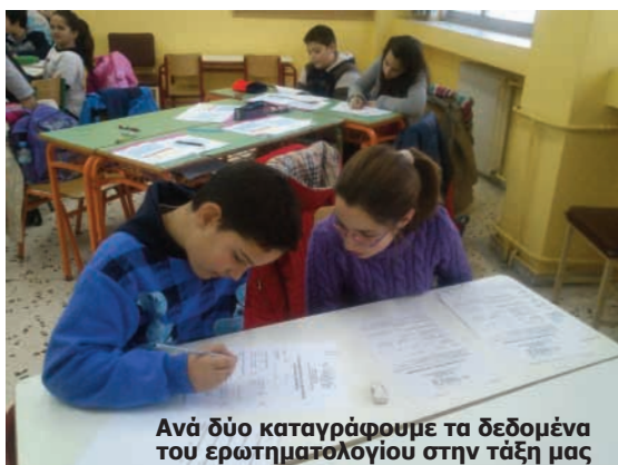
Ανά δύο καταγράφουμε τα δεδομένα του ερωτηματολογίου στην τάξη μας

Μόλις τα παιδιά συμπλήρωσαν τα ερωτηματολόγια, τα συγκεντρώσαμε όλα και όλα τα παιδιά του τμήματος κάναμε την κατα-